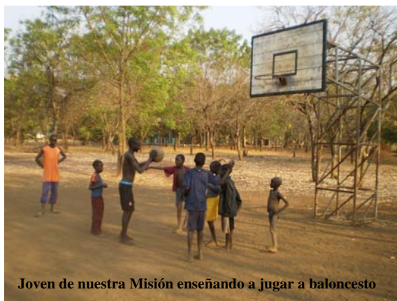
Joven de nuestra Misión enseñando a jugar a baloncesto

Prácticamente se realizan dos pruebas durante la secundaria; la primera es para evaluar el nivel de cada estudiante y si es acto para pasar a los dos últimos cursos o no lo es de la secundaria. Y una última prueba al final del último curso de la Secundara, que de aprobarlo estaría en condiciones de estudiar en las Escuelas superiores o en las Escuelas preparatorias para la Universidad.