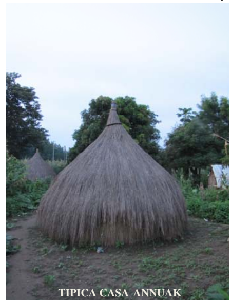
TÍPICA CASA ANNUAK

En Abobo el índice de población joven es elevado. Entre ellos siempre existe, una demanda de creación y condicionamiento de instalaciones deportivas para la práctica de diversos deportes y ofrecer una zona para dichas actividades que no hay en otra parte de Abobo. En Abobo los colegios no tienen pistas deportivas. Y de otro lado es muy difícil que desde la población joven asuman ciertos gastos. Por poner un ejemplo un balón de fútbol cuesta alrededor de 350 Ethiopian birr(moneda local), lo que al cambio al euro puede ser (unos 15 euros), puesto que la mayor parte de la población vive de la pesca y del cultivo para abastecerse, es un gasto este, con el que no pueden correr. Si además, tenemos en cuenta que el sueldo de un enfermero, personal