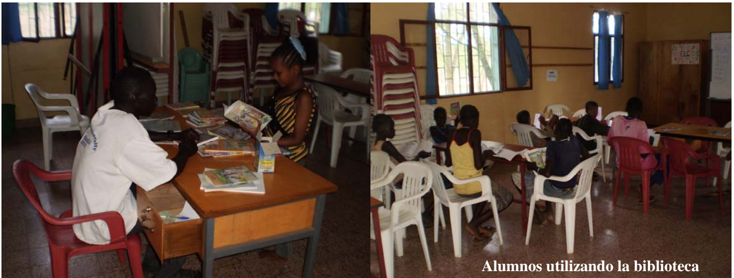
Alumnos utilizando la biblioteca