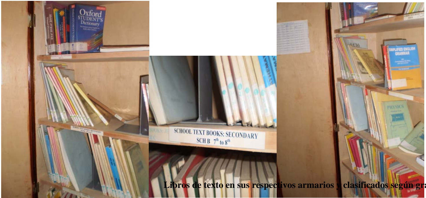
Libros de texto en sus respectivos armarios y clasificados según grado y