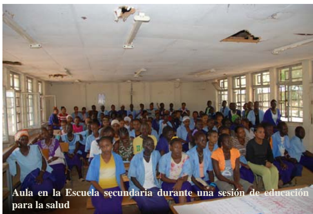
Aula en la Escuela secundaria durante una sesión de educación para la salud